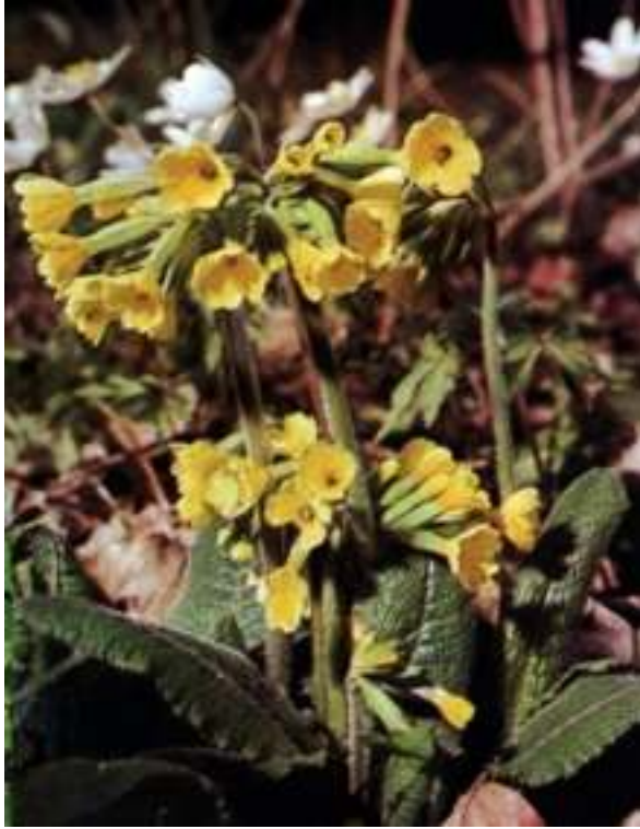
Waldschlüsselblume, im Hintergrund Buschwindröschen